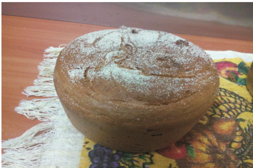
Хлеб из тритикалевой муки по экспрессной технологии

Зерно озимой тритикале Аргус в первую очередь предназначено для хлебопечения. Так, содержание белка в зерне в отдельные годы (2021 год) достигает 15,3% (табл. 11).