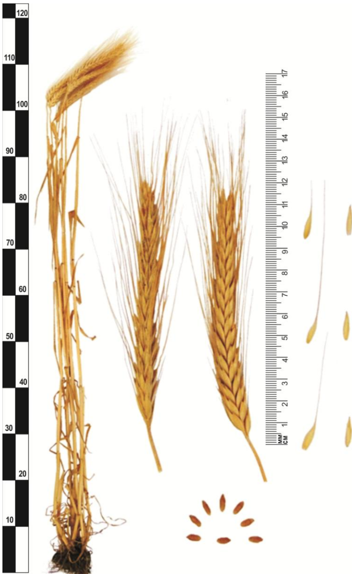
Озимая тритикале Аргус®